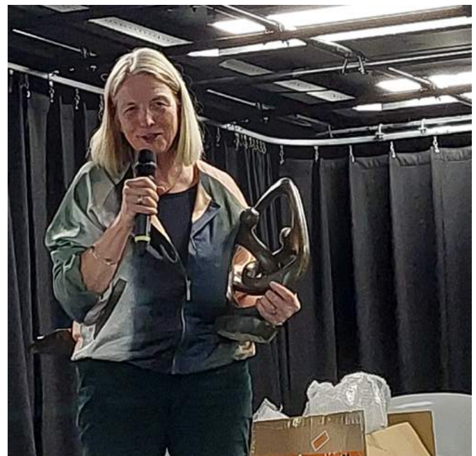
Afscheid Stytia STGS