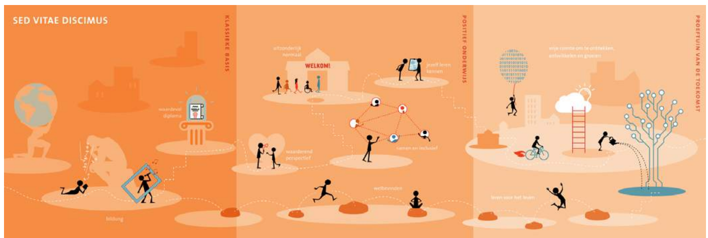
illustratie: infographic Stichting Het Zelfstandig Gymnasium 2020